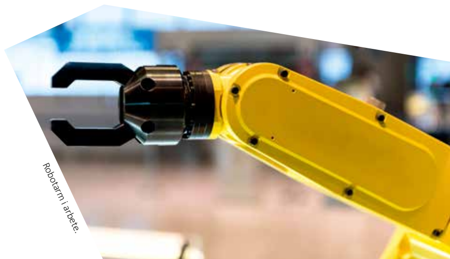
Robotarm i arbete.

Mer information om aktuella arbetslivskonferenser och rapporter från tidigare konferenser finns på museets hemsida, under samlingar-forskning.