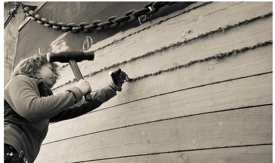
Drifning av babords bog på ketchen Ariel.

Om drefjärnet hålles av en man under det att en annan sköter drefhammaren, kallas arbetet jagning. Efter slutad drifvning infylles becket ovanpå drefvet, och sedan becket kallnat, bortskrapas den del däraf, som befinner utanför nåtet.