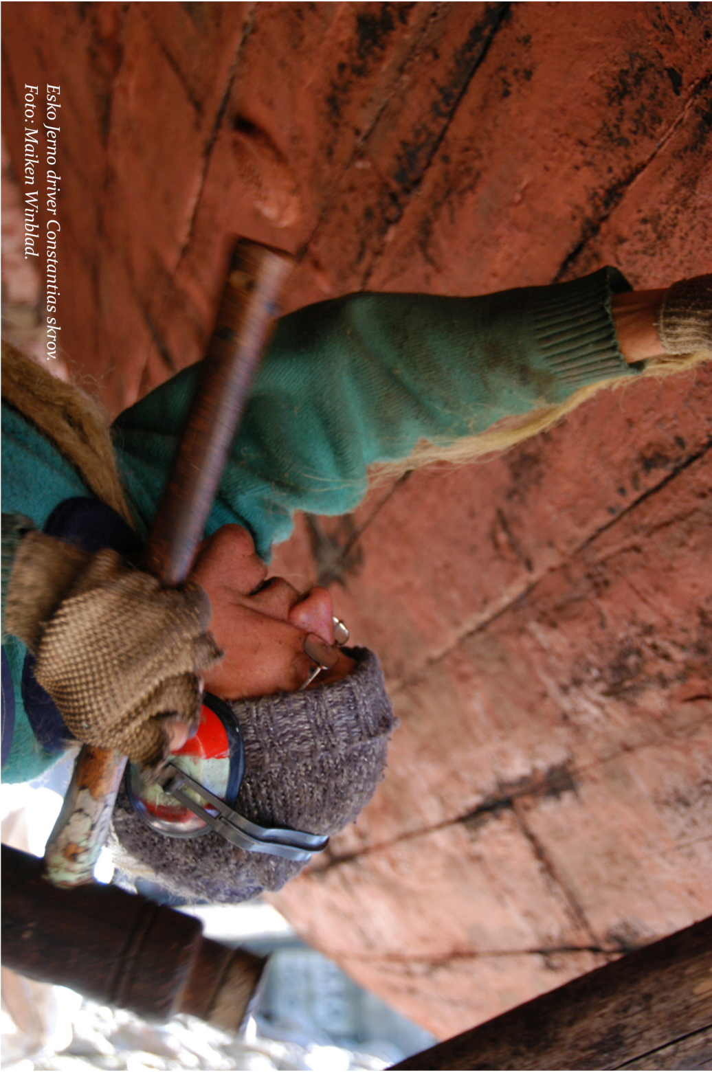
Esko Jerno driver Constantias skrov.