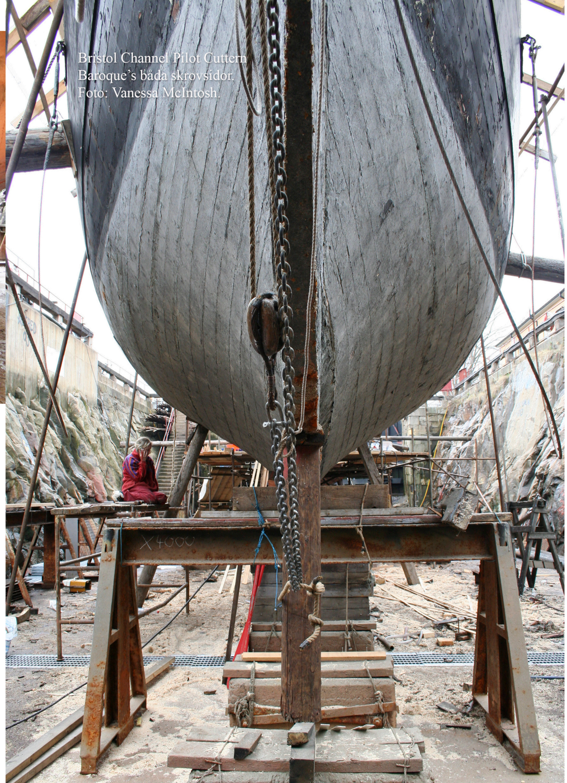
Bristol Channel Pilot Cutter Baroque's båda skrovsidor.