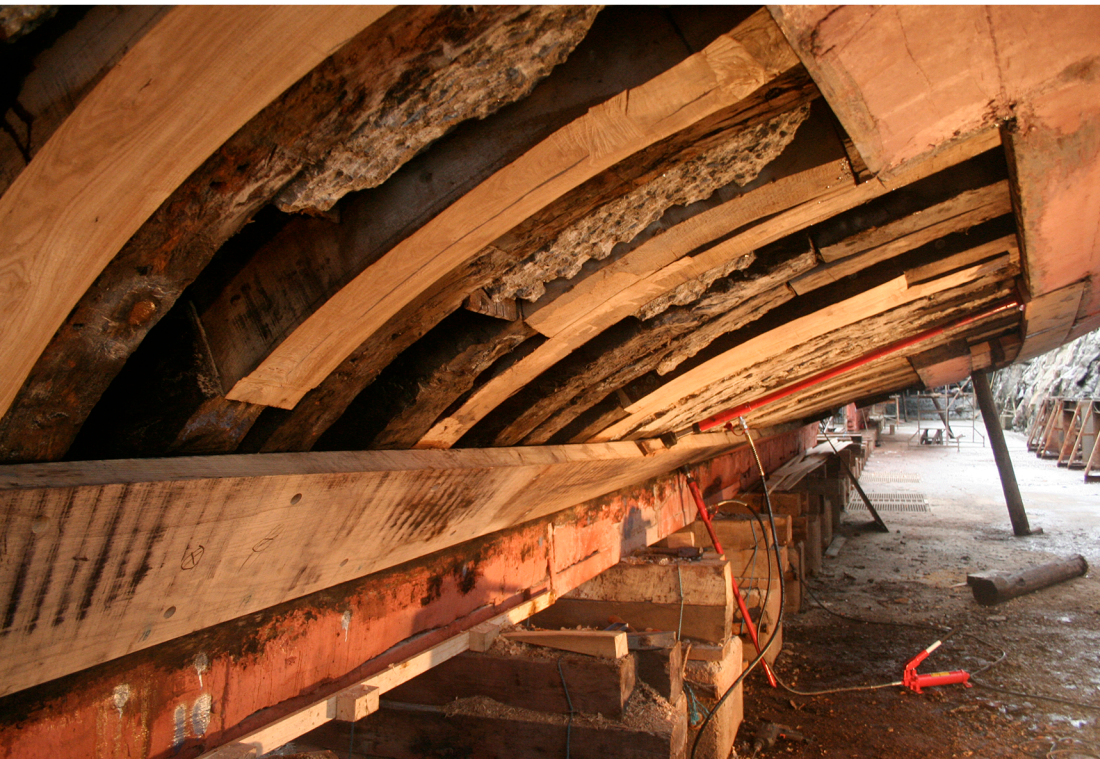
Slätskonerten Ellen får nya spant och bord i botten. Fartygsdelarna nedifrån: köl, sambord, bottenstockar, spant och bordläggning.

Kursmaterial till „Kurs i drivning och Beckning,, Kursen ges i samarbete mellan Arbetets museums kunskapsutbytesprojekt för arbetslivsmuseer och Sveriges Segelfartygsförening/Beckholmens dockförening.